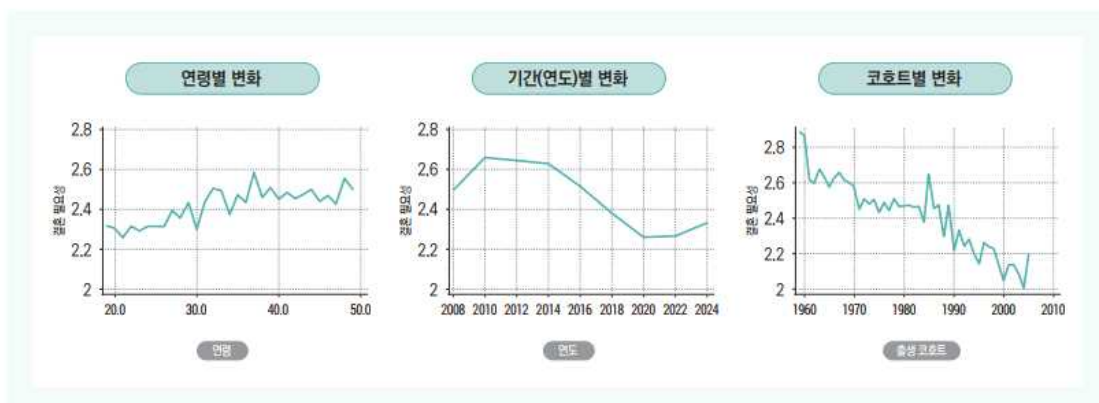
[그림 5] 결혼 필요성에 대한 인식 변화(만 19~49세 가임기 여성 대상, 2008~2024년)

주: 1) "결혼은 반드시 해야 한다"(4점 척도: 1점=전혀 그렇지 않다~4점=매우 그렇다).